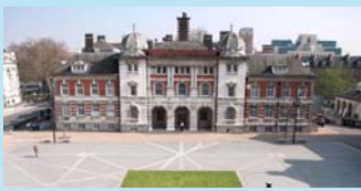
ロンドン芸術大学 CCW (イギリス・ロンドン)