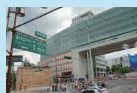
弘益大学校 (韓国・ソウル)