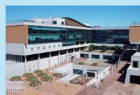
韓国芸術総合学校 (韓国・ソウル)