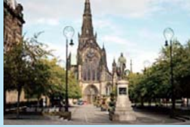
グラスゴー美術学校 (イギリス・グラスゴー)