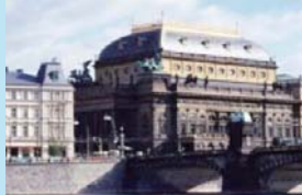
国立芸術アカデミー映画学部 (チェコ・プラハ)