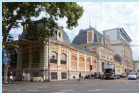
ジュネーブ造形芸術大学 (スイス・ジュネーブ)