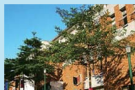
国立台北芸術大学 (台湾・台北)