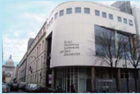
国立高等装飾美術学校 (フランス・パリ)