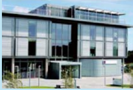
ボーンマス芸術大学 (イギリス・ボーンマス)