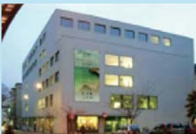
ボゼン・ボルツァーノ自由大学 (イタリア・ボルツァーノ)