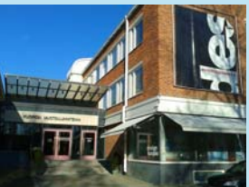
サヴォニア応用科学大学 (フィンランド・クオピオ)