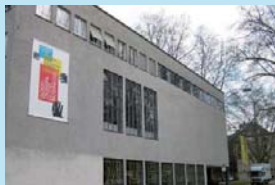
チューリッヒ芸術大学 (スイス・チューリッヒ)