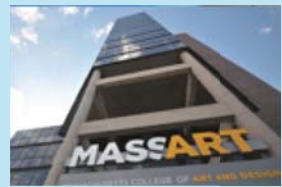
マサチューセッツ芸術大学 (アメリカ・ボストン)