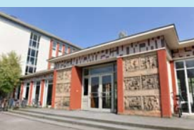
ヴァイセンゼー美術大学 (ドイツ・ベルリン)