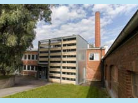
メトロポリア応用科学大学 (フィンランド・ヘルシンキ)