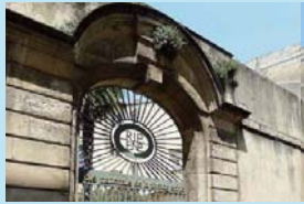
国立高等写真学校 (フランス・アルル)