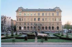
プラハ美術工芸大学 (チェコ・プラハ)