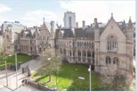
ノッティンガム・トレント大学 (イギリス・ノッティンガム)