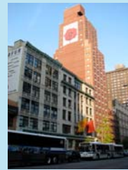
スクール・オブ・ヴィジュアル・アーツ (アメリカ・ニューヨーク)