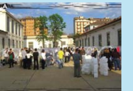
ミラノ新美術アカデミー (イタリア・ミラノ)