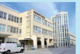
コンストファク/ 国立芸術工芸デザイン大学 (スウェーデン・ストックホルム)