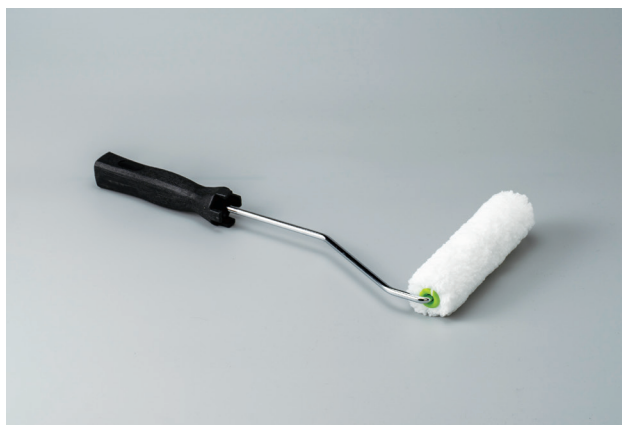
ペイントローラー