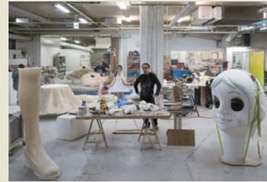
ULTRA FACTORY 世界で活躍するアーティストとともに最先端のプロジェクトに挑戦。