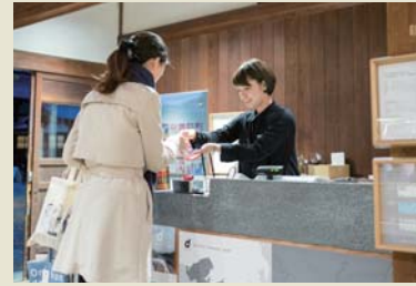
D&DEPARTMENT KYOTO by 京都造形芸術大学 日本初、学生による店舗運営で、売り場からデザインの実験を学ぶ。