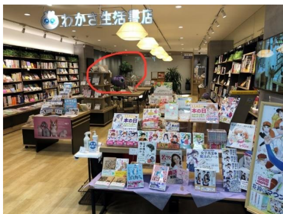
展示スペースは正面出入口から見て左奥です。

※ ③は12/18（土）17:00～18:30にトークイベントがありますので、その時間は展示スペースが閉鎖状態になります